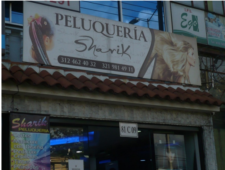
Fotografía No. 2: Establecimiento PELUQUERÍA SHARIK ubicado en la Av. Esperanza No. 81 C – 09 Local 2